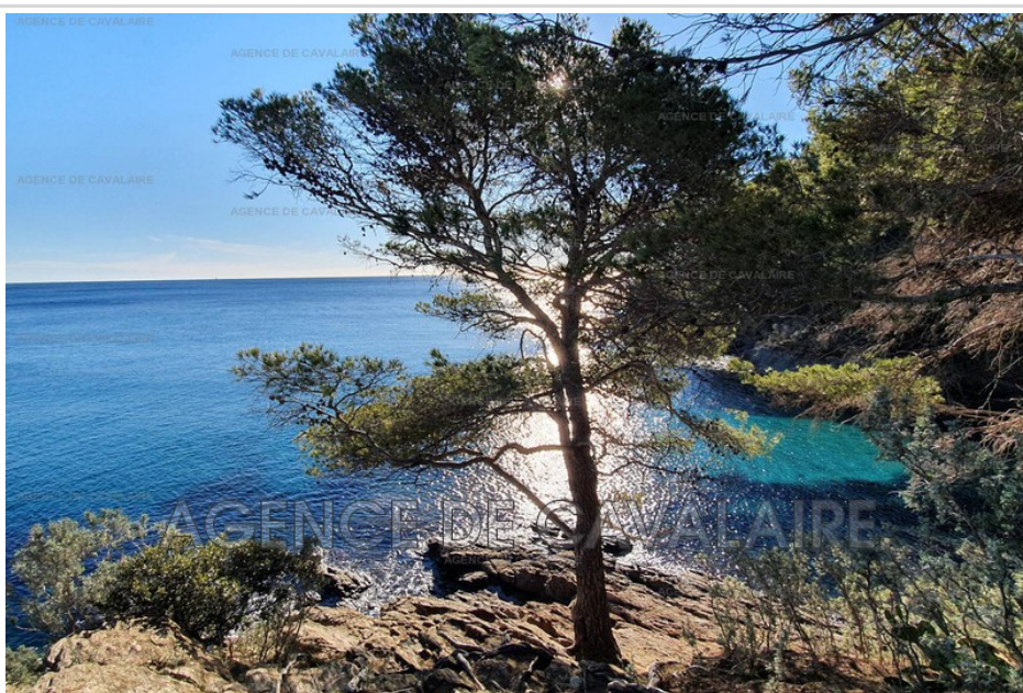
Studio + mezzanine LEVANT 30 Cavalaire-sur-Mer